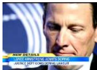
Lance Armstrong interview with Oprah FULL Part 2